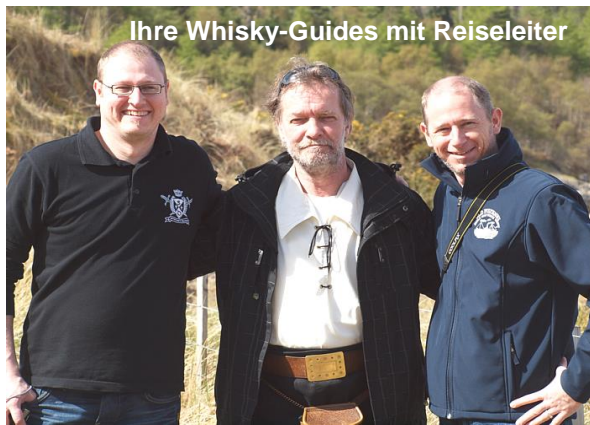
Ihre Whisky-Guides mit Reiseleiter

Unsere Reisen zeichnen sich durch eine überschaubare Gruppengrösse aus. Wer schon mit uns gereist ist, weiss dass die Beziehungen unserer Whisky-Guides Türen öffnen, die auf einer normalen 08/15 - Reise verschlossen bleiben.