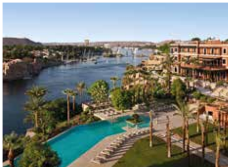
Sofitel Legend Old Cataract ★★★★★ Assuan

Das in der Nubischen Wüste majestätisch auf rosa Granit am Nilufer erbaute Luxushotel bietet einen einmaligen Blick auf den Nil und wird Sie in jeder Hinsicht verwöhnen.