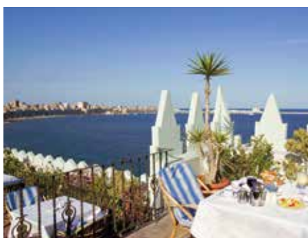
Steigenberger Cecil Hotel ★★★★★ Alexandria

An der Küstenstrasse von Alexandria liegt dieses luxuriöse Hotel. Nach einem Stadtrundgang wartet das Meer am privaten Hotelstrand oder der Pool mit Panoramansicht auf Sie!