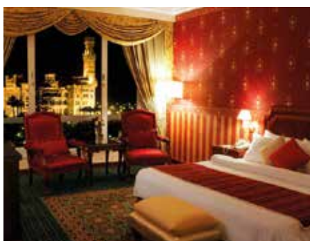
Helnan Palestine Hotel ★★★★★ Alexandria

Das Hotel mit Blick auf die Bucht liegt im Zentrum von Alexandria. Das 1929 erbaute Haus mit 89 Zimmern verbindet modernen Komfort mit dem Charme vergangener Zeiten.