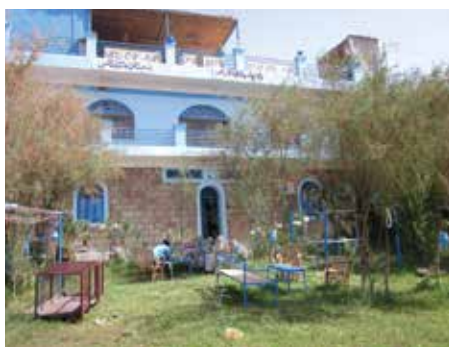
Bet El Kerem ★★ Assuan

Das Erstklasshotel Mövenpick Elephantine Island Resort mit 226 Zimmern ist eine Oase auf der Elephantine-Insel mitten im Nil mit traumhaftem Ausblick und tadellosem Service.