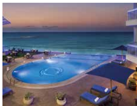
Hilton Alexandria Corniche ★★★★★ Alexandria

Direkt am Nassersee liegt dieses einfache Hotel (136 Zimmer). Der beste Ausgangspunkt um die Abu Simbel-Tempelanlagen beim Sonnenaufgang oder Sonnenuntergang zu erleben.