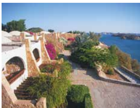
Seti Abu Simbel Lake Resort ★★★ Abu Simbel

Das einfache nubische Gasthaus unter niederländischer Leitung mit nur 9 Zimmern befindet sich am Westufer des Nils in authentischer Atmosphäre, abseits des Touristenrummels.