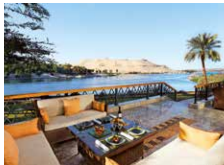
Mövenpick Resort ★★★★★ Assuan

Das Hotel befindet sich an einzigartiger Lage auf der idyllischen Isis-Insel mit einem grossen, üppigen Garten. Die Zimmer bieten eine schöne Aussicht auf den Garten oder den Nil.