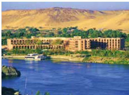
Pyramisa Isis Island ★★★★★ Assuan

Das in der Nubischen Wüste majestätisch auf rosa Granit am Nilufer erbaute Luxushotel bietet einen einmaligen Blick auf den Nil und wird Sie in jeder Hinsicht verwöhnen.