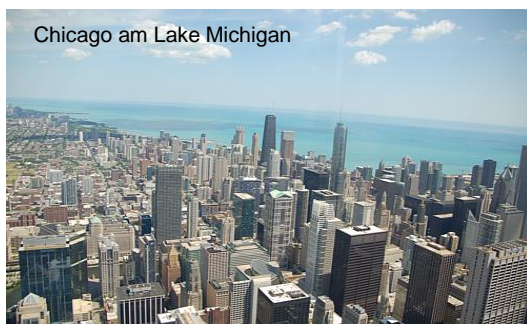
Chicago am Lake Michigan

Der Ablauf der Reise ist aufgrund persönlicher Erfahrungen optimiert, u.a. um Rotlichtmarathons wenn immer möglich zu umfahren und dort zu übernachten, wo es auch Sinn macht. Die Ø Länge einer Tagesetappe ist mit rund 190 Meilen (305 Kilometer) so konzipiert, dass Sie gemütlich auf der Route cruisen und die Attraktionen unterwegs geniessen sowie bei Ankunft jeweils noch etwas unternehmen können.